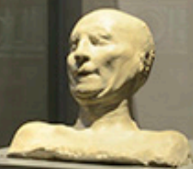
Plaster bust of a man, likely a portrait of a patron or a figure related to the architectural work.